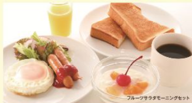
フルーツサラダモーニングセット