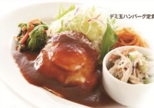
デミ玉ハンバーグ定食