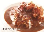
唐揚げビーフカレー