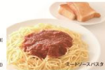
ミートソースパスタ